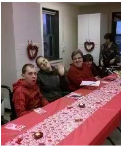
Et à Granby on a célébré la St-Valentin et le temps des sucres.